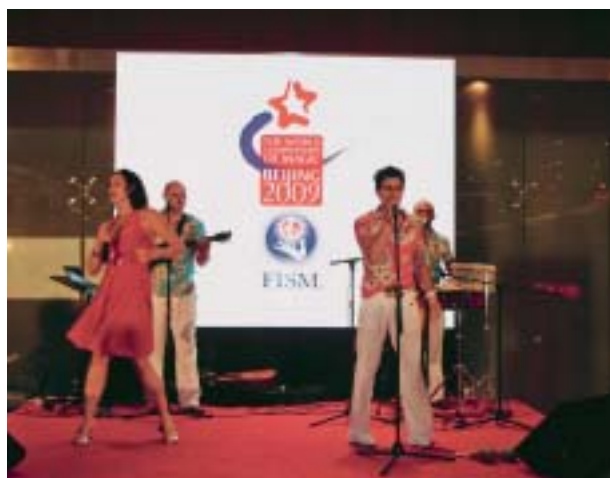
Zabava u večernjim satima uz ples i umjetnički program domaćina