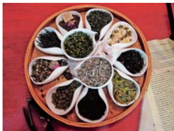
Kineski čajevi služeni su u pauzama između natjecanja i seminara