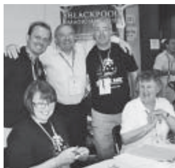
Organizacijski odbor iz Blackpool-a slavi dobivanje domaćinstva FISM 2012.

Na kraju četvrtog dana objavljeno je kako će domaćin idućeg Svjetskog prvenstva biti Blackpool u Velikoj Britaniji