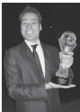
Soma iz Mađarske, svjetski prvak u kategoriji Opći iluzionizam i osvajač Grand Prixa 2009.