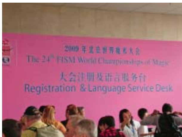
Gužva prilikom registracije više od 3000 sudionika Prvenstva