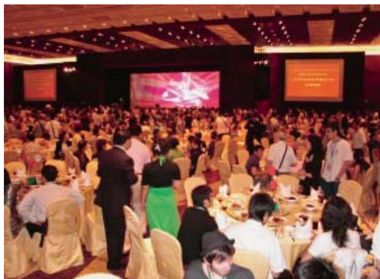
Banket dobrodošlice sa prigodnim programom domaćina