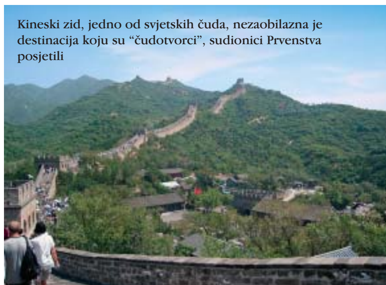
Kineski zid, jedno od svjetskih čuda, nezaobilazna je destinacija koju su "čudotvorci", sudionici Prvenstva posjetili